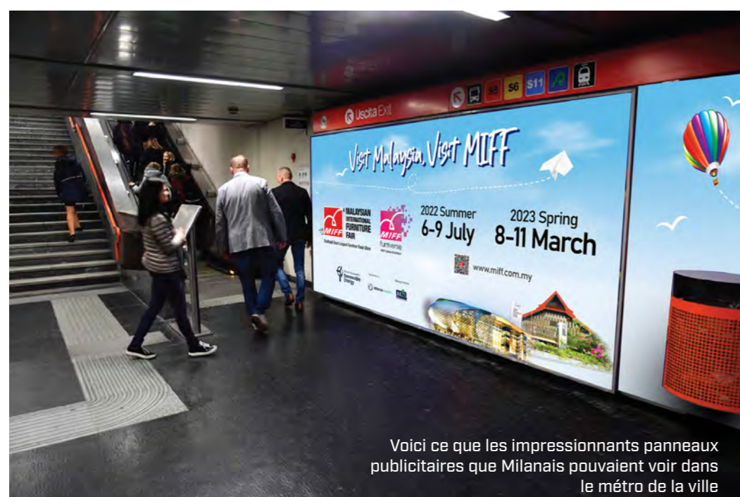
Voici ce que les impressionnants panneaux publicitaires que Milanais pouvaient voir dans le métro de la ville

Obligation de télécharger l'appli vaccinale Mysjahtera possible depuis le pays d'origine où à l'arrivée.