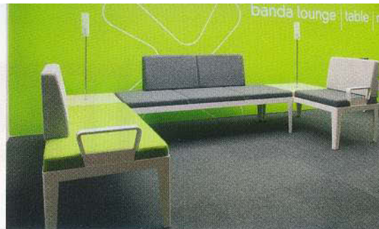
Als Objektmöbel vielfältig einsetzbar und individuell zu gestalten: das Programm Banda der Taz Corporation. Designer ist der Schweizer Daniel Korb.

Angebote, die sich stark an den Vorlieben britischer Einkäufer oder von Interessenten aus dem Mittleren Osten orientieren. Doch es gibt auch Beispiele von Anbietern, die sich sowohl von der Formensprache als auch bezüglich der Materialien anders orientieren. Zu erwähnen sind beispielsweise Hin Lim mit seinen modernen Essgruppen und Schlafzimmern, Fernex, der stark auf amerikanische Weißbeiche setzt oder aber New PK Furniture, der mit recyceltem Holz aus Brasilien arbeitet.