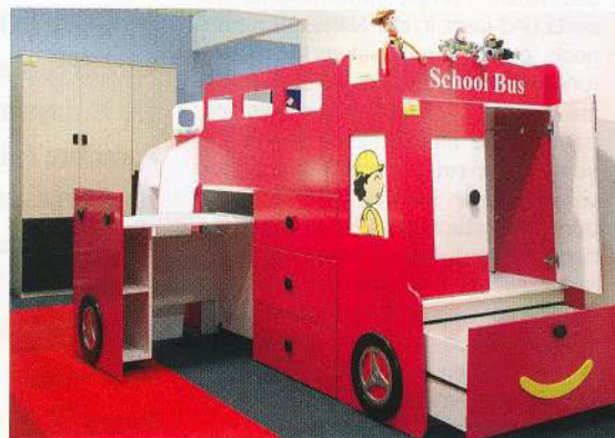
Viel praktischen Nutzen auf wenig Raum bietet diese Kinderzimmer-Innovation von BJ Cabinet.

Von allen auf der MIFF präsentierten Produktgruppen weisen Büromöbel den höchsten Standard auf. Zwei Beispiele: der umklappbare Bürotisch „Ephiphy“ des japanischen Herstellers Kukuyo und der neue Bürostuhl „Trendy“ von Benithem.