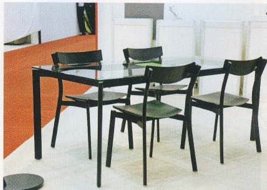
Der japanische Hersteller Shibasaki gewann den während der MIFF vergebenen Furniture Excellence Award in der Rubrik Essplätze.

Längst reicht die Ausstellungsfläche im Putra World Trade Center nicht mehr aus. In diesem Jahr waren vor allem die Anbieter von Polstermöbeln im modernen Kuala Lumpur Convention Center untergebracht, einem großzügig gestalteten Konferenz- und Ausstellungszentrum im Schatten der weltberühmten Petronas Towers, die nach wie vor das spektakulärste Wahrzeichen der malaysischen Hauptstadt sind.