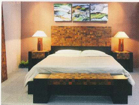
New PK Furniture siegte mit diesem Bett aus recyceltem brasilianischen Holz in der Sparte Schlafraum.